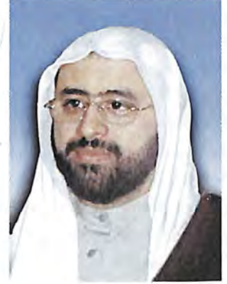
بِسْمِ اللَّهِ الرَّحْمَنِ الرَّحِيمِ

الحمد لله جزيل النعماء والآلاء، وجميل الأفضال والعطاء، وحسين البلاء، وجميل العظمة والكبرياء، وصلى الله على محمد وآله النبلاء، الذين خصهم بالعصمة والولاء، وجعلهم بأكمل التناء، وجعلهم ملوك الدنيا والآخرة والأولى، صلى الله عليه وعليهم ما دامت الأرض والسماء. (العصمة والرجعة للشيخ الأوحـد قدس سره)