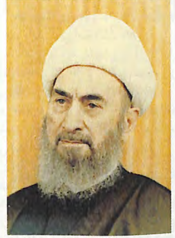
رسالة الإنسانية ومنهج لصياغة الإنسان وفق رسالة السماء

ومتى كان الحبيب هو المحبوم الأسنى، الذي خلق الجمال، وفجر العطف والرحمة، وكان واهب الكمال... فلا مجال لتصور حد السعادة وعظمة الإفاضة، ولذة الوصال!! كم هو لذيذ أن يكون المحبوب طالباً